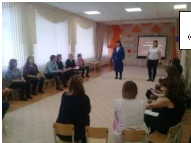
Теоретическая часть «Праздник – это важно»