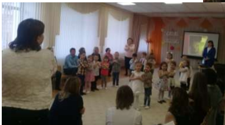
Практическая часть Коммуникативная игра «Здравствуйте»