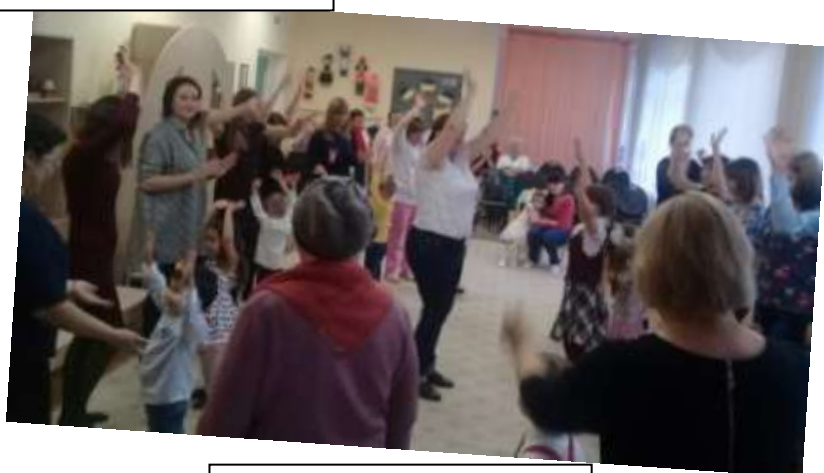
Танцевальная игра «Пяточка - носочек»