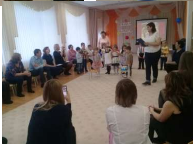
Взаимодействие с родителями