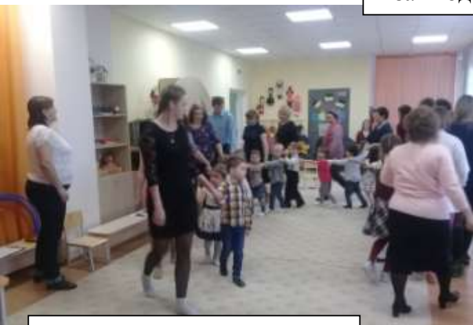
Подвижная игра «Паровоз»